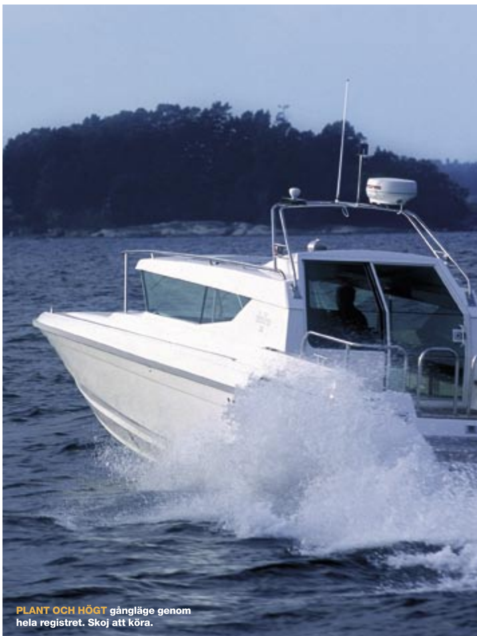
PLANT OCH HÖGT gångläge genom hela registret. Skoj att köra.

talston tar vi oss fram över skärgårdsfjärdarna. Volvo Pentas D6 bjuder upp med kraft och välanpassad ljuddämpning ser till att hålla nere dieselnas morrande. Finishen på inredningen är nu god, vilket inte riktigt var fallet på de första båtarna. Ordning och reda på produktionen som numera är förlagd till Estland, har gett resultat. Det syns överallt. På det rostfria. På träarbeten. På skrovfinish. Det harmonierar och skapar en air av lagom blandning av lyx och arbete.