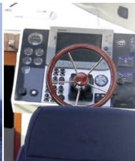
DET DIGITALA har trängt ut det analoga. Stor skärm i centrum och utmärkt sikt ut. Stolarna – eller kanske snarare sofforna fram – är både bekväma och funktionella.